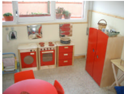
Nova cuineta de P3

L'escola i l'APA amb el vist i plau del Consell Escolar a l'any 1999 va impulsar la socialització de llibres amb l'esperit de retornar a valors educatius com la cooperació, la solidaritat i la importància de compartir i també, per que no dir-ho, davant l'elevada despesa que comporta per a la majoria de famílies la compra de llibres. Socialitzar és, pel nen, bàsicament aprendre a compartir, i pels pares significa un estalvi de temps, espai i diners.