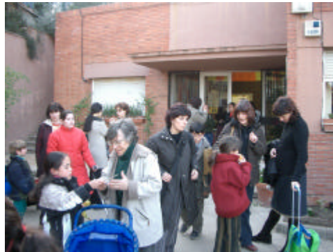
La sortida de l'escola

seu nen a les imatges, mentre tota la família ansiosa menja crispetes en una sessió de cine familiar.