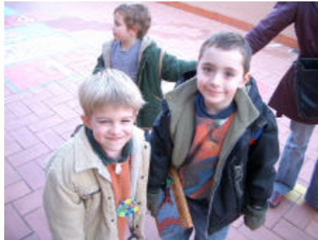
Nens de P4 a la sortida d'escola

Agenda 21: A part del tema de l'aigua (Veure article en la pag.1), es seguirà amb altres temes com el compostatge, i es mirarà com condicionar l'escola per a fer una recollida selectiva eficaç.