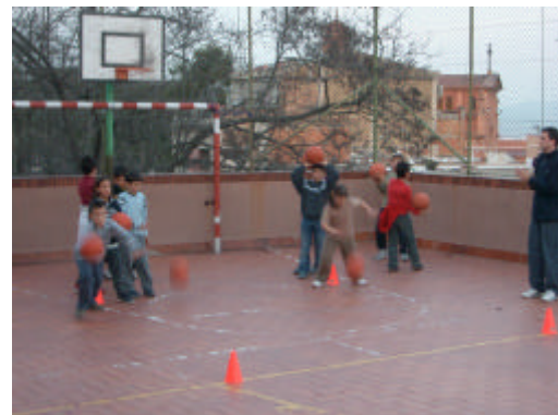
Nens jugant a Bàsquet a "Roda d'Esports"

Respecte als alumnes de roda d'esports de 3r. hauran fet el seu primer partit (amistós) fora de les instal·lacions de l'escola, concretament a l'escola Font d'en Fargues el passat 4 de Febrer.