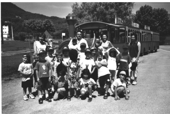
Excursió amb el tren Xinu-Xano (colònies curs 2003/04)

Dia de lliure disposició: Finalment queda decidit el dia 13 de maig com a dia de lliure disposició.