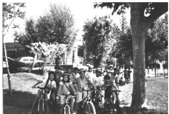
Excursió en bicicleta (colònies curs 2003/04)