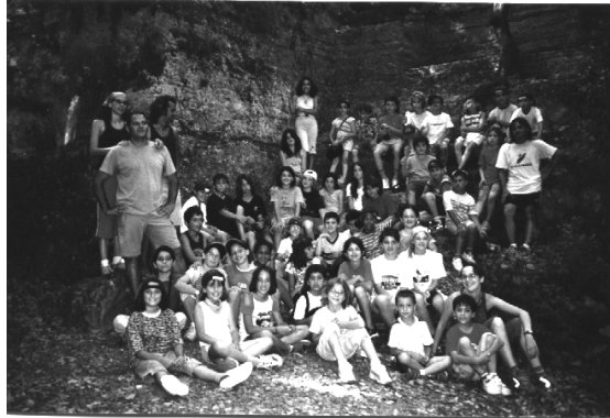
Alguns nens que van participar a les colònies (El Vilar, Banyoles)