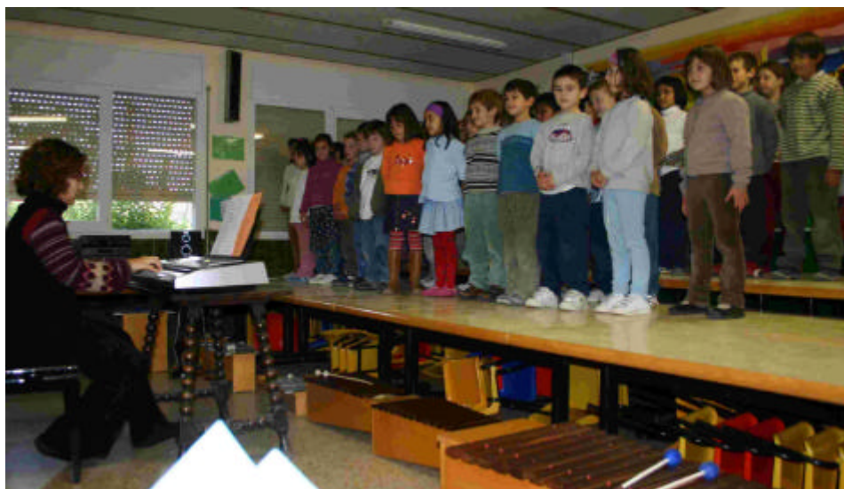
Els Nens de 1r i 2n al Concert de Nadal