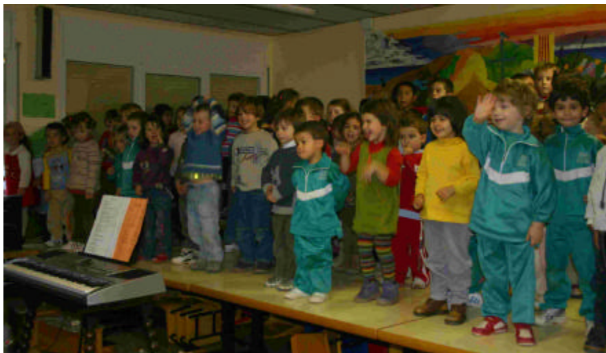
Els Nens de P3, P4 i P5 al Concert de Nadal