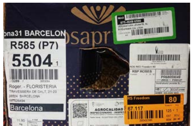
Recorregut d'una caps de roses: Equador - Madrid - Barcelona

Malgrat tot, al Maresme hi ha les més preuades, perquè han crescut veient la mar, amb l'escalforeta del sol mediterrani i amb la insistència de perdurar en el nostre paisatge.